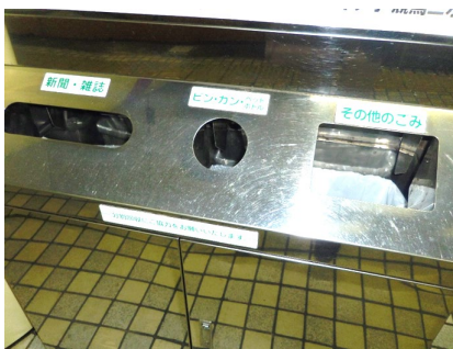
改善前(日本語のみの分別表示)

※ 行政相談委員は、行政相談委員法に基づき行政運営上の改善意見を総務大臣に述べることができます。