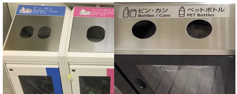
改善後(英語とイラストが併記された分別表示)